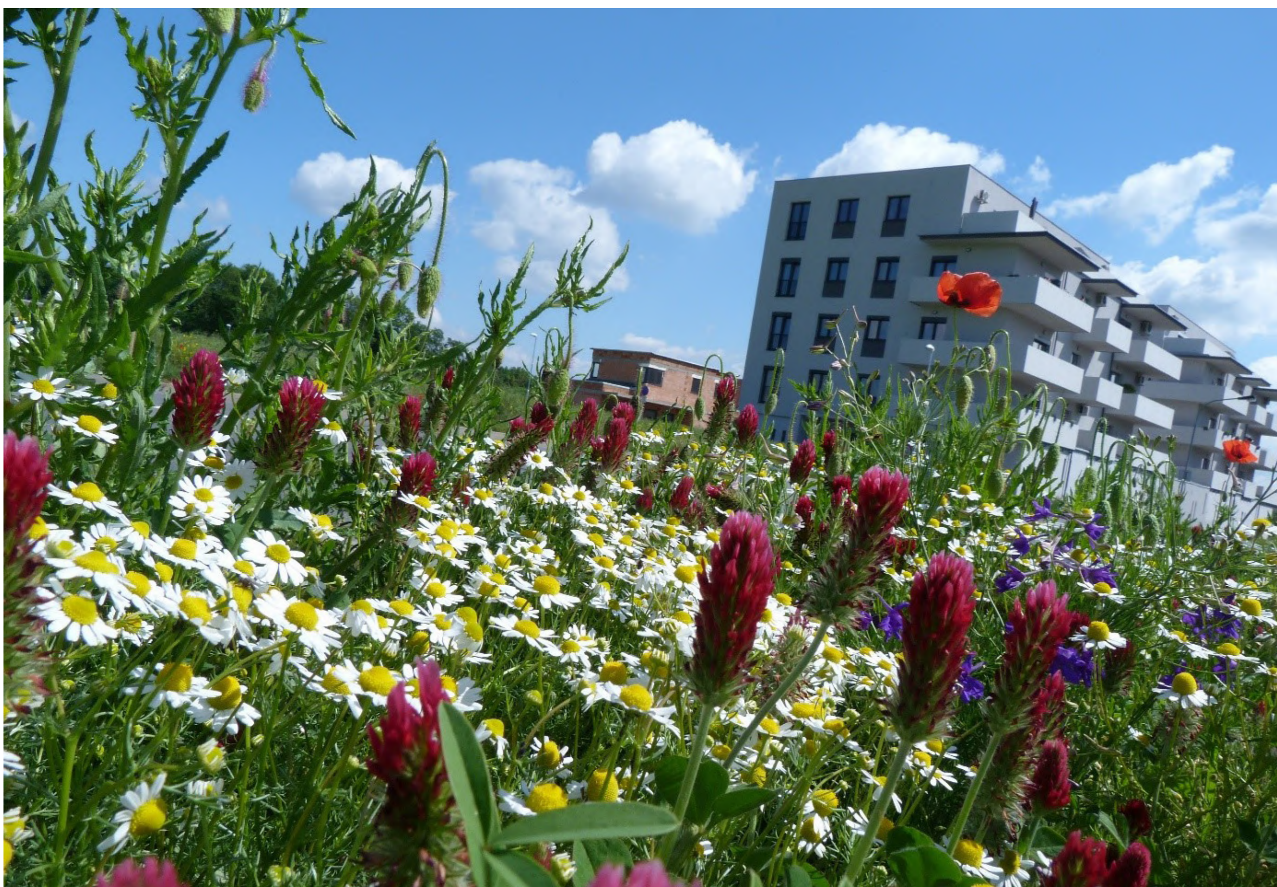
Luční směs „Papilio“ na ulici Josefa Lady obsahuje pestré směs rostlin využitelných motýly a dalším hmyzem. Po nachovém jetelu, heřmánku a vlčíh mácích zde pokvetou vičence, štirovníky, tolice a řebříčky.

Není to jen o tom, že lahodí oku, ale poskytují domov mnoha druhům organismů. Vyšší porost také lépe hospodaří s vláhou a dokáže si pro ni „šáhnout“ i do hlubších vrstev půdy. V neposlední řadě působí jako přírodní lapače prachu. Luční porosty jsou tedy více než jen krásné a své místo ve městě si určitě zaslouží.