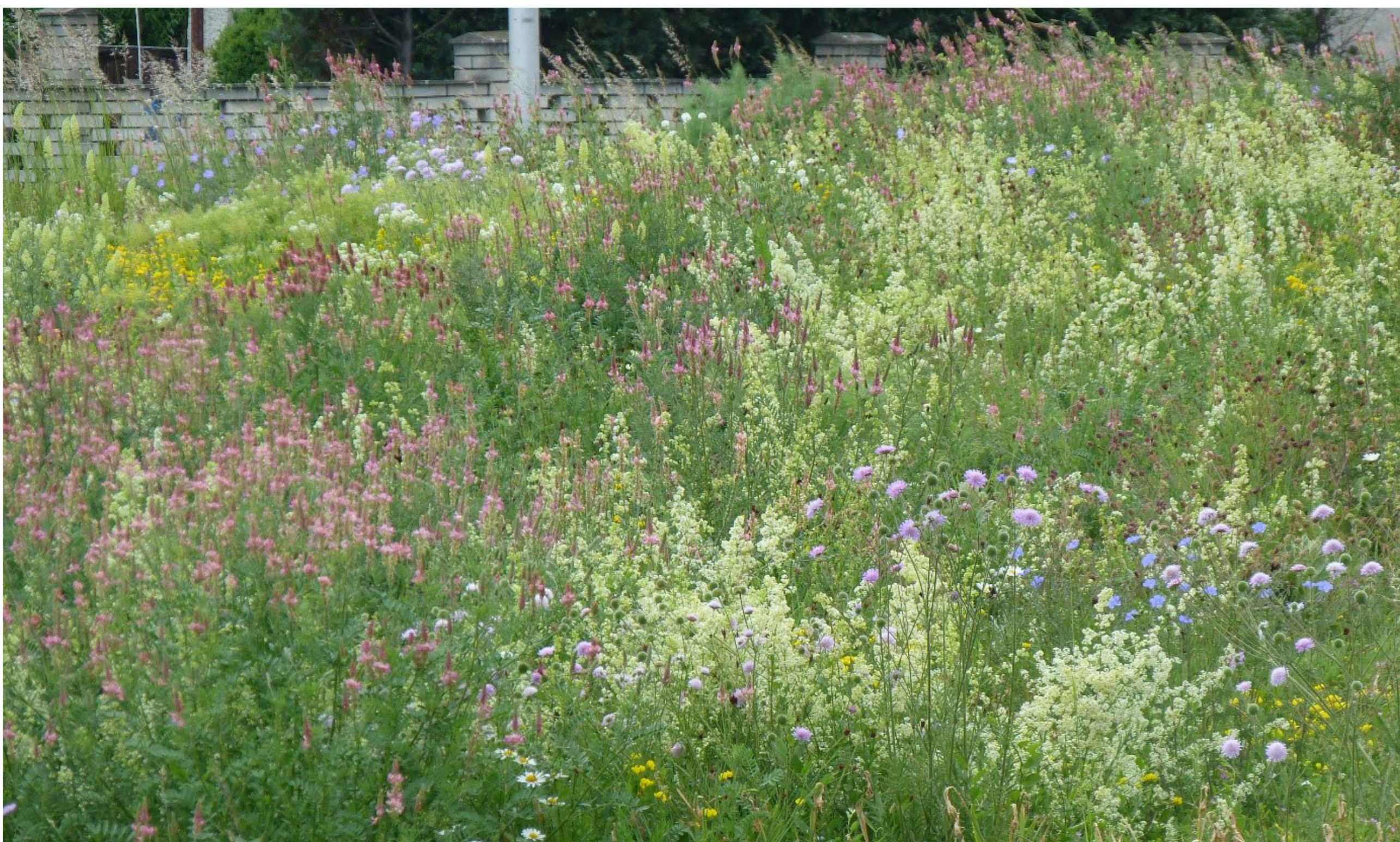
Kruhový objezd na Plumlovské- v pestré kompozici září bílé kopretiny, krémová květenství rýtu, nebesky modrý len či žluté „papučky“ štirovníku.