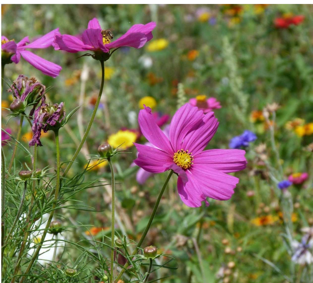
Pro rychlý nástup „rozkvetlého“ efektu se na exponovaných místech využívají luční směsi s podílem letniček. Foto z ulice Dolní v loňském roce.