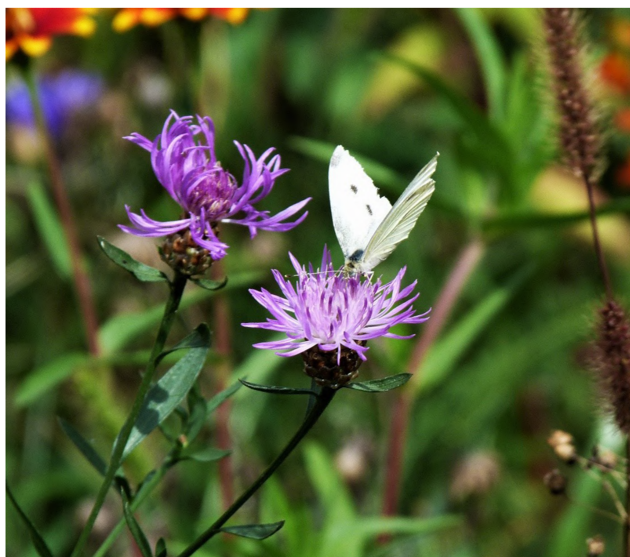
Louky tu nejsou jen pro potěchu oka, ale poskytují domov a potravu celé řadě organismů.