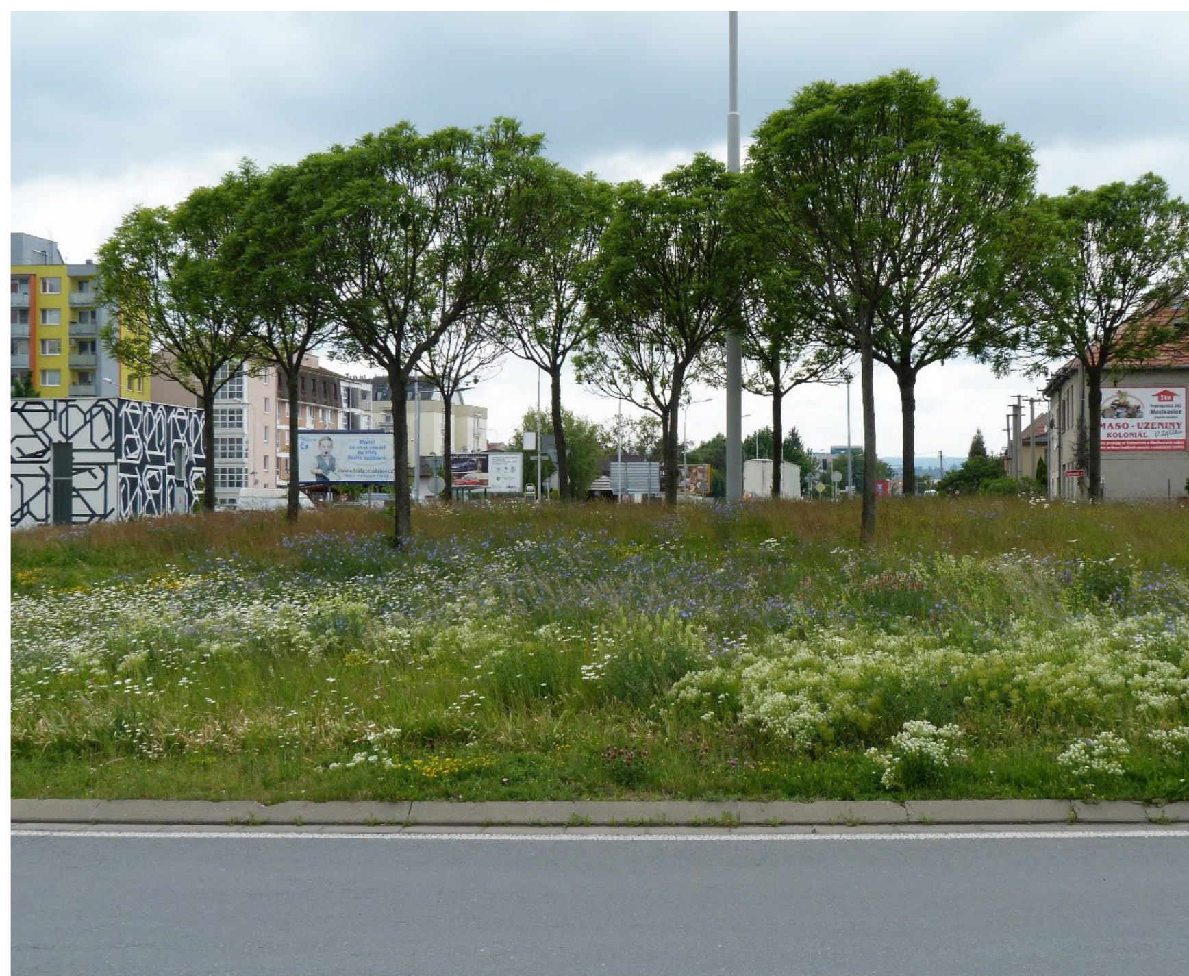
Kruhový objezd na Plumlovské – tady se městská louka rozrůstá od roku 2015.