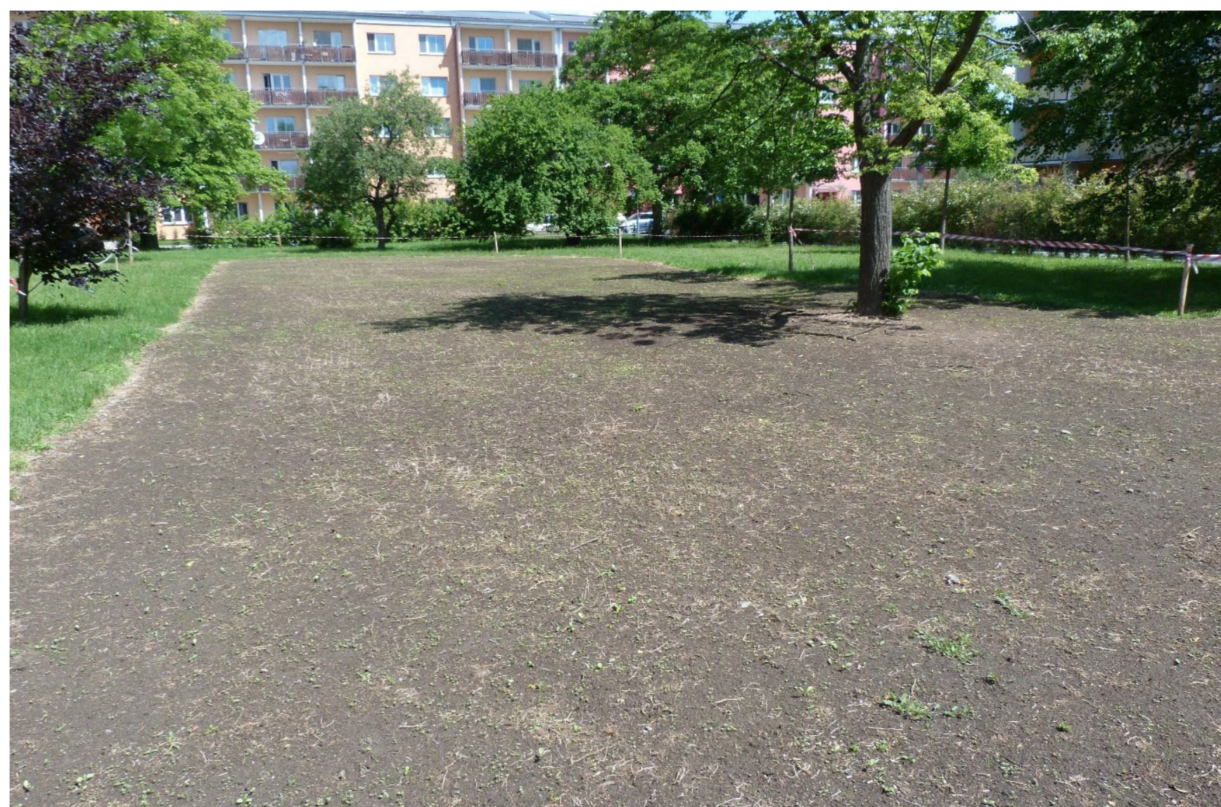
Louky na sídlišti Svobody krátce po zasetí v roce 2020. Dnes se již jedná o skvěle fungující kvetoucí plochu.