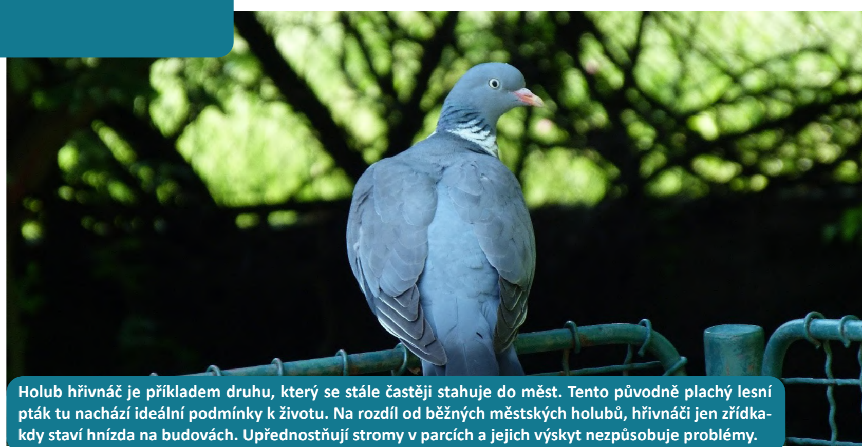
Holub hřivnáč je příkladem druhu, který se stále častěji stahuje do měst. Tento původně plachý lesní pták tu nachází ideální podmínky k životu. Na rozdíl od běžných městských holubů, hřivnáči jen zřídka-kdy staví hnízda na budovách. Upřednostňují stromy v parcích a jejich výskyt nezpůsobuje problémy.