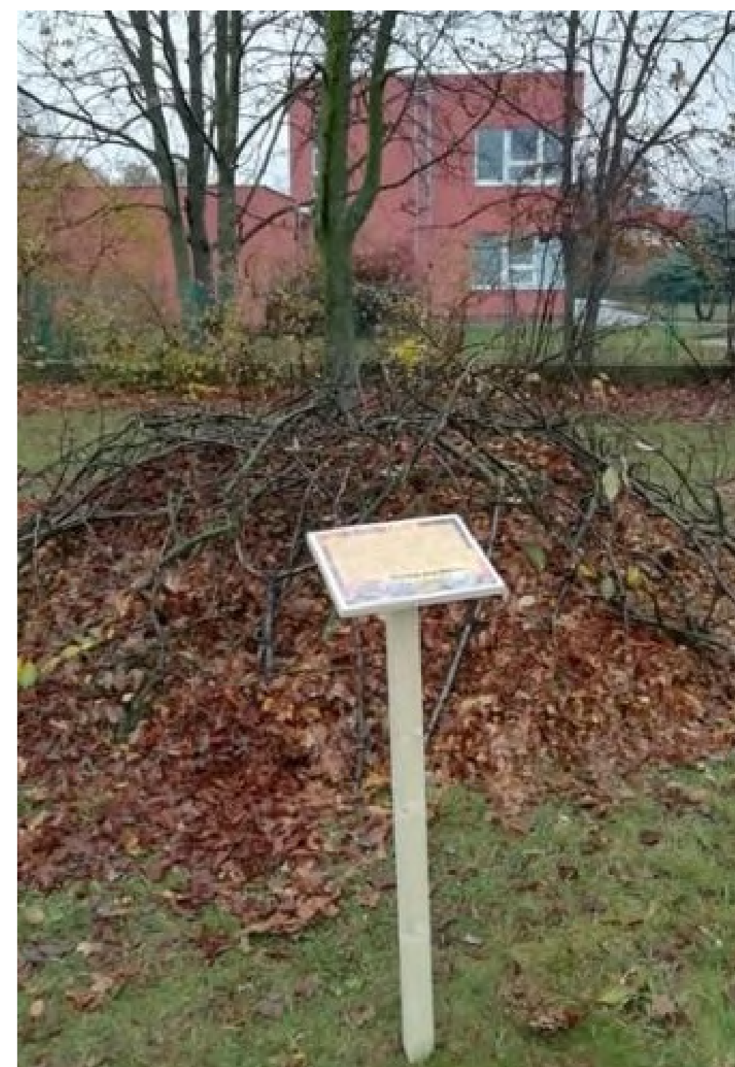
Torza stromů ponechaná v biokoridoru Hloučela poskytují rozmanité hnízdní příležitosti pro ptactvo i pro vývoj bezobratlých živočichů.