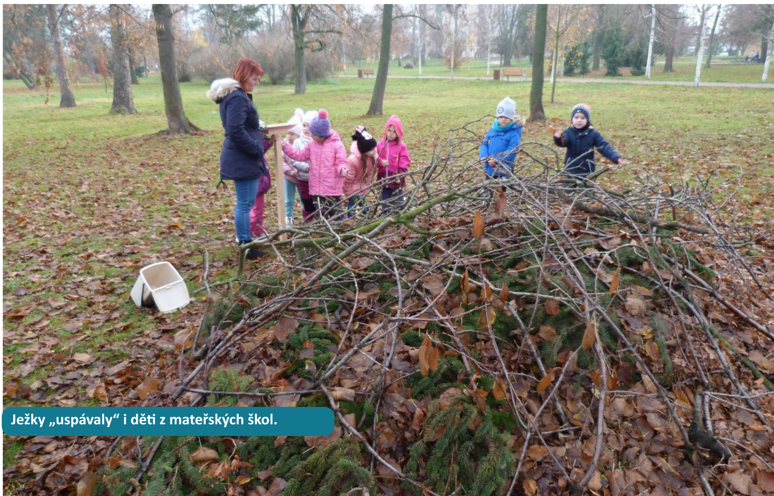
Ježky „uspávaly“ i děti z mateřských škol.