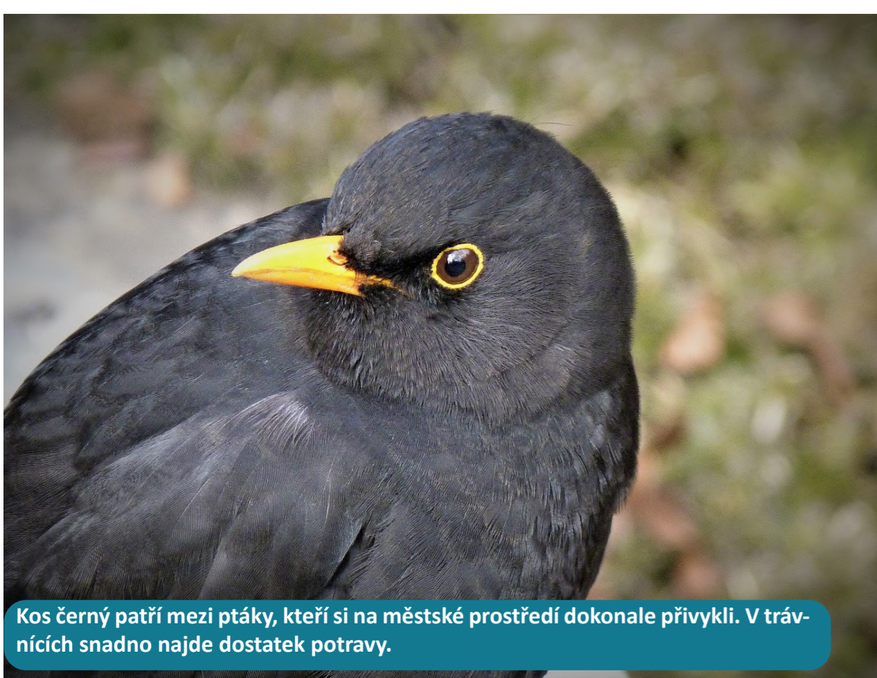
Kos černý patří mezi ptáky, kteří si na městské prostředí dokonale přivykli. V trávnících snadno najde dostatek potravy.