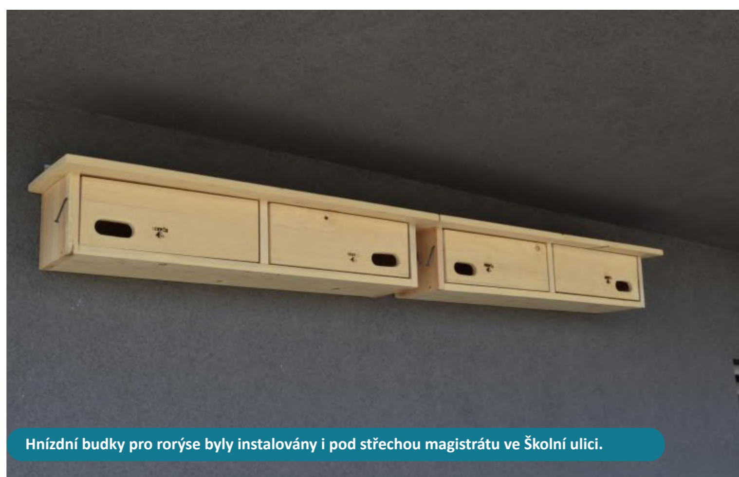
Hnízdní budky pro rorýse byly instalovány i pod střechou magistrátu ve Školní ulici.