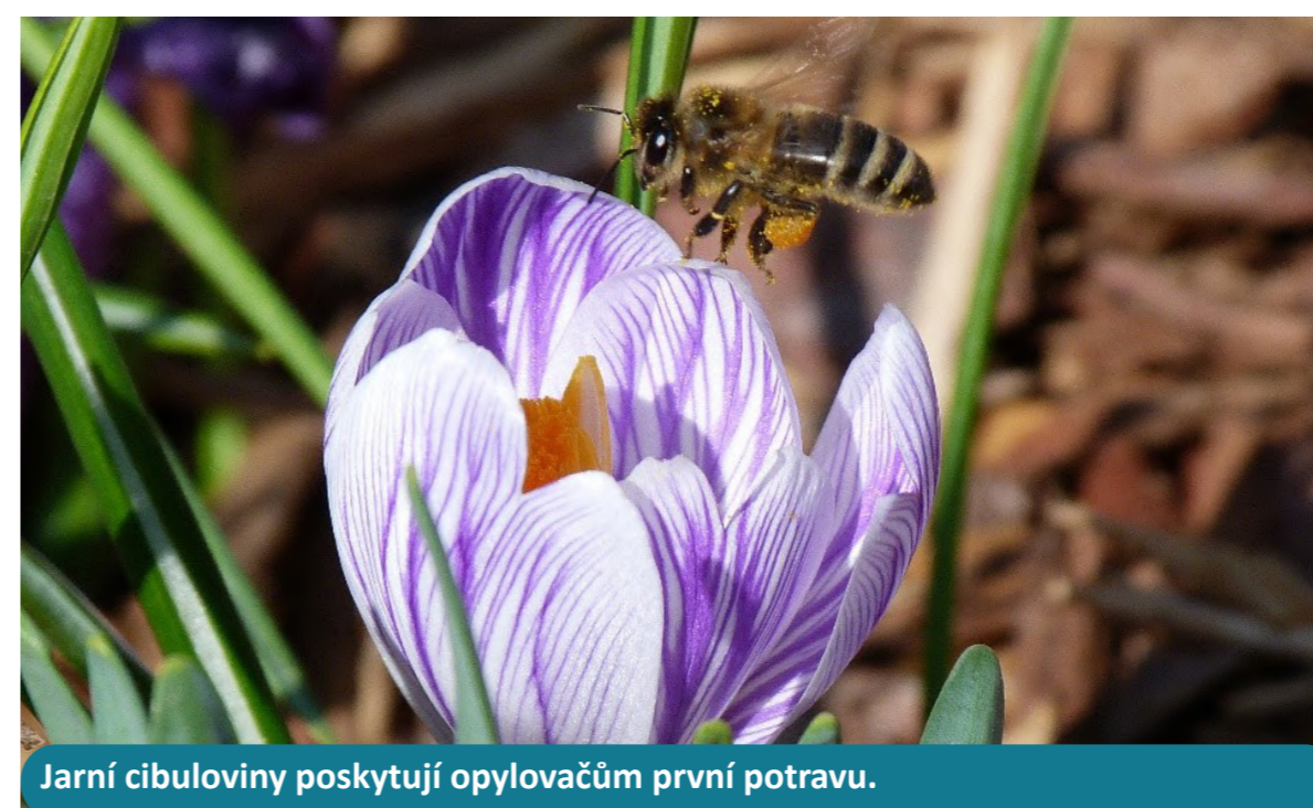
Jarní cibuloviny poskytují opylovačům první potravu.