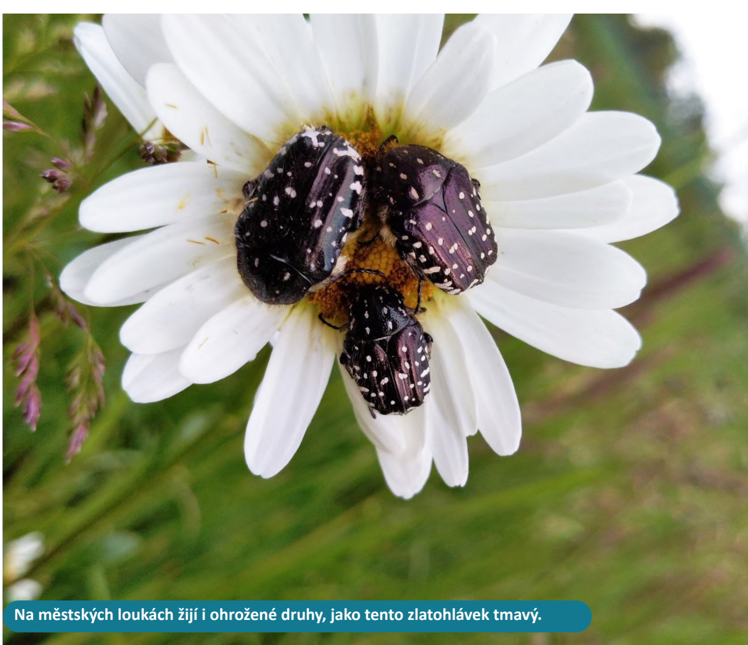
Na městských loukách žijí i ohrožené druhy, jako tento zlatohlávek tmavý.