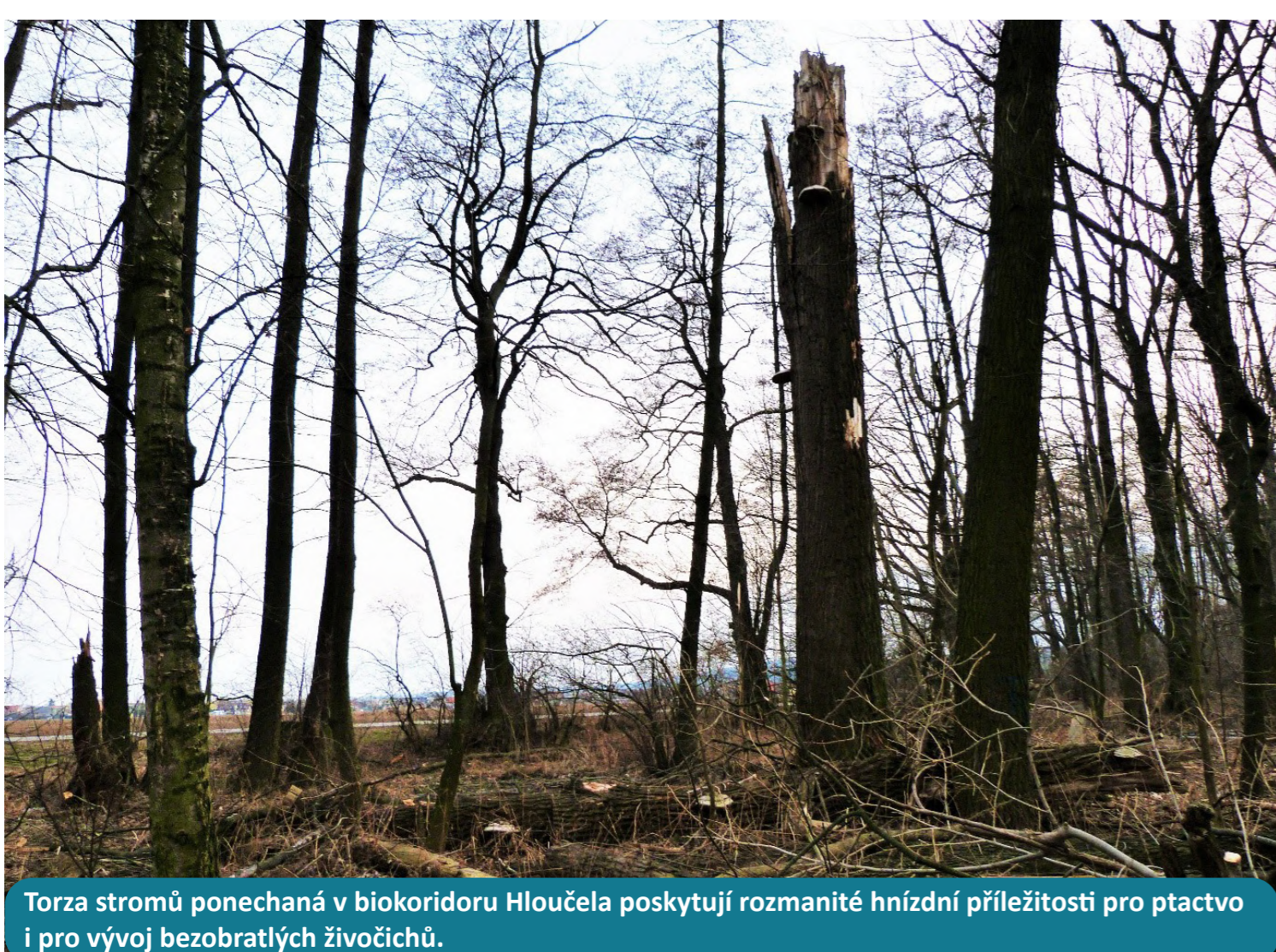
Torza stromů ponechaná v biokoridoru Hloučela poskytují rozmanité hnízdní příležitosti pro ptactvo i pro vývoj bezobratlých živočichů.