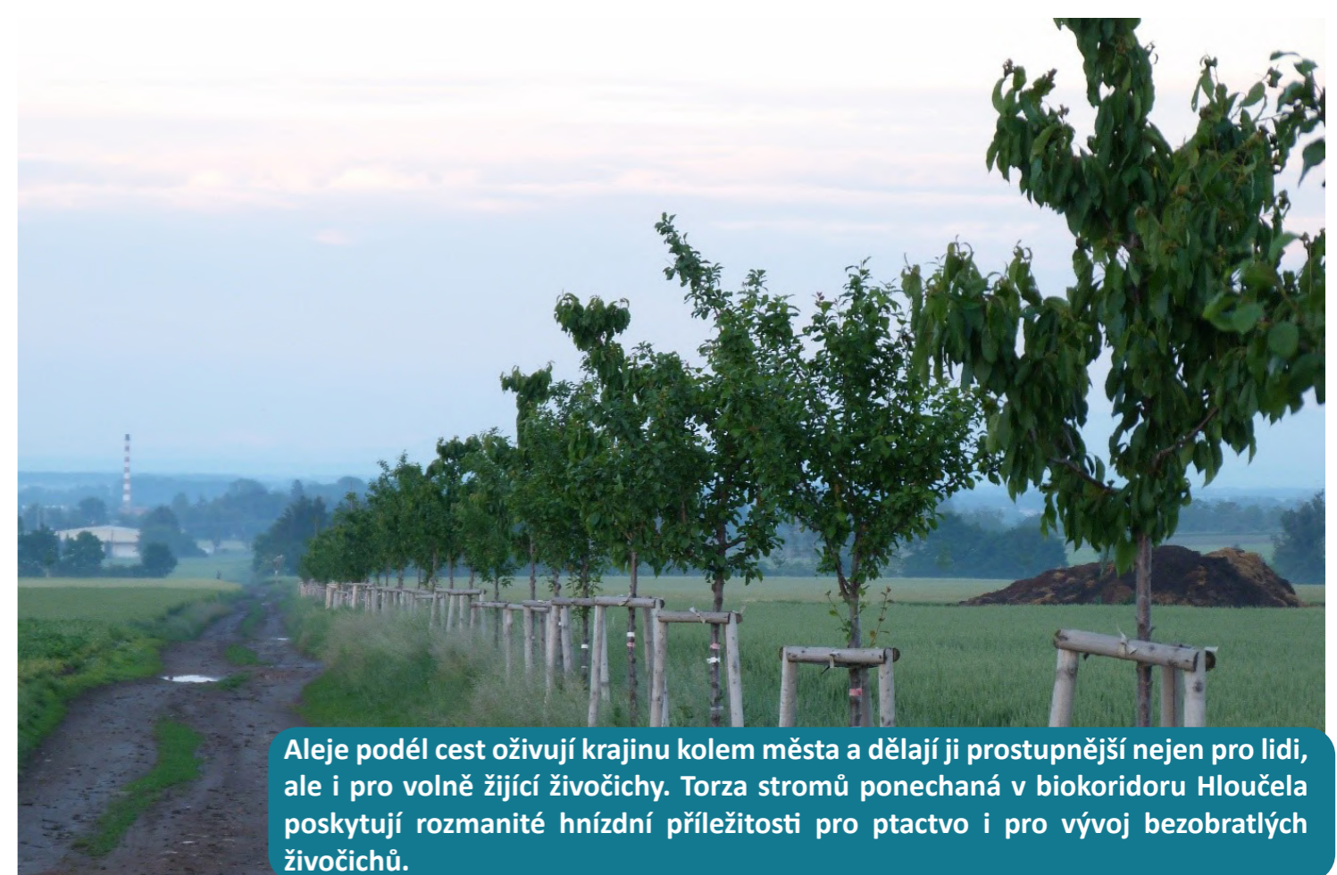
Aleje podél cest oživují krajinu kolem města a dělají ji prostupnější nejen pro lidi, ale i pro volně žijící živočichy. Torza stromů ponechaná v biokoridoru Hloučela poskytují rozmanité hnízdní příležitosti pro ptactvo i pro vývoj bezobratlých živočichů.

Ačkoliv se to na první pohled nezdá, nabízí městská krajina volně žijícím živočichům mnoho příležitostí. Zejména v zemědělské krajině Hané je město ostrovem biodiverzity. Správnými opatřeními můžeme ve městech tento efekt ještě zesílit. Jakými kroky například město pomáhá volně žijícím živočichům?