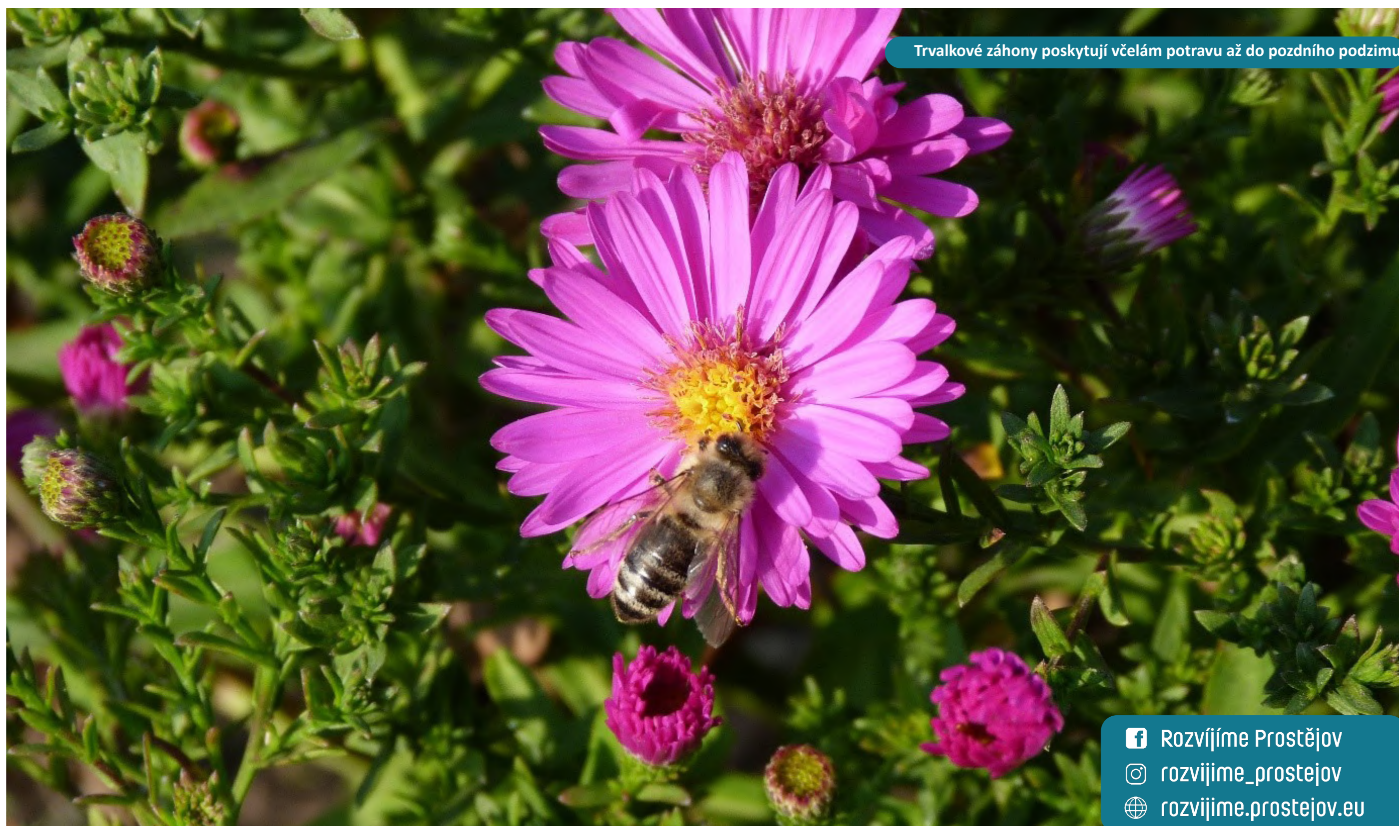
Trvalkové záhony poskytují včelám potravu až do pozdního podzimu.